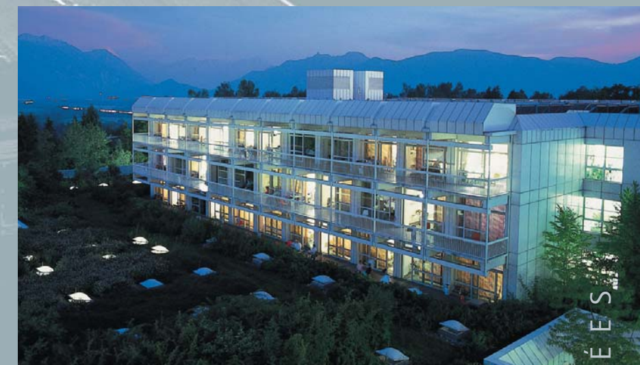
Berufsgenossenschaftliche Unfallklinik – clinique, Murnau, D Architectes Köhler Et Brinkmann; Architecte Zinner, Munich, D