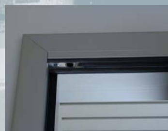
Grâce à la combinaison possible de la porte RST Kuffner dans tous les types d'habillage, qu'elles soient en aluminium, acier ou bois, l'aménagement d'un chantier reste l'œuvre des architectes.