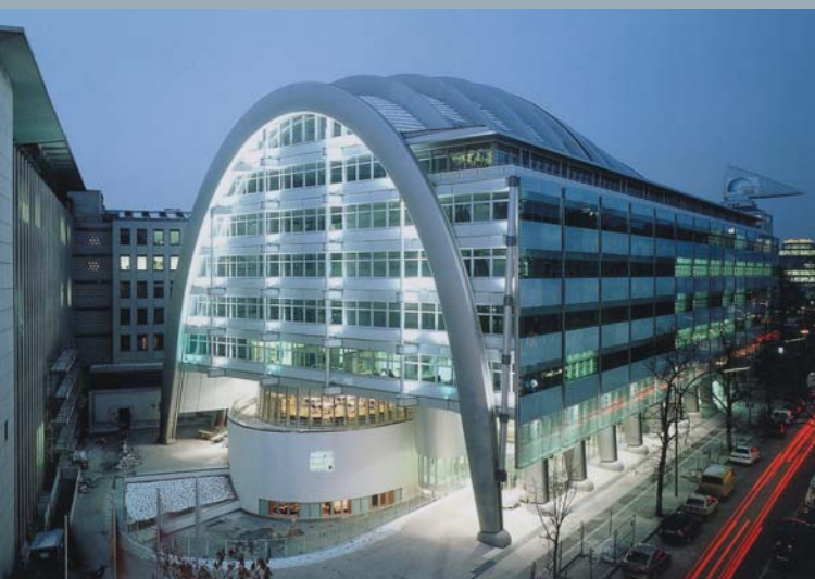
Ludwig Erhard Haus, Berlin, D Architecte Nicholas Grimshaw Et partenaires