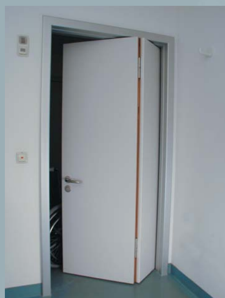
Porte à encombrement réduit et pour personnes handicapées Kuffner Brevet P.357.9006--7-08