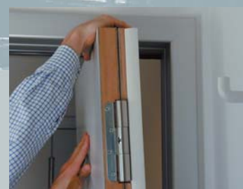
La pose ultérieure d'une porte RST Kuffner, en tant qu'élément de rénovation est possible dans toute huisserie existante. La porte peut en cas d'urgence être ouverte de l'extérieur.