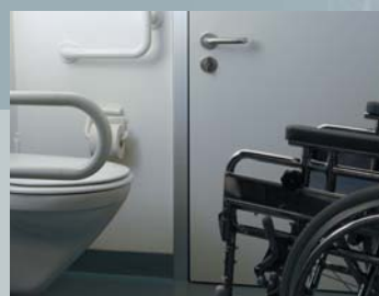
La porte RST Kuffner à âme tubulaire, âme pleine ou PVC, avec tous les traitements de surface, ainsi qu'exécution de chants désirés, même avec les chants en polyuréthane injecté.