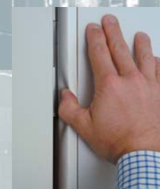
La pose d'un joint caoutchouc anti-pince-doigt entre les panneaux réduit le risque d'accident.